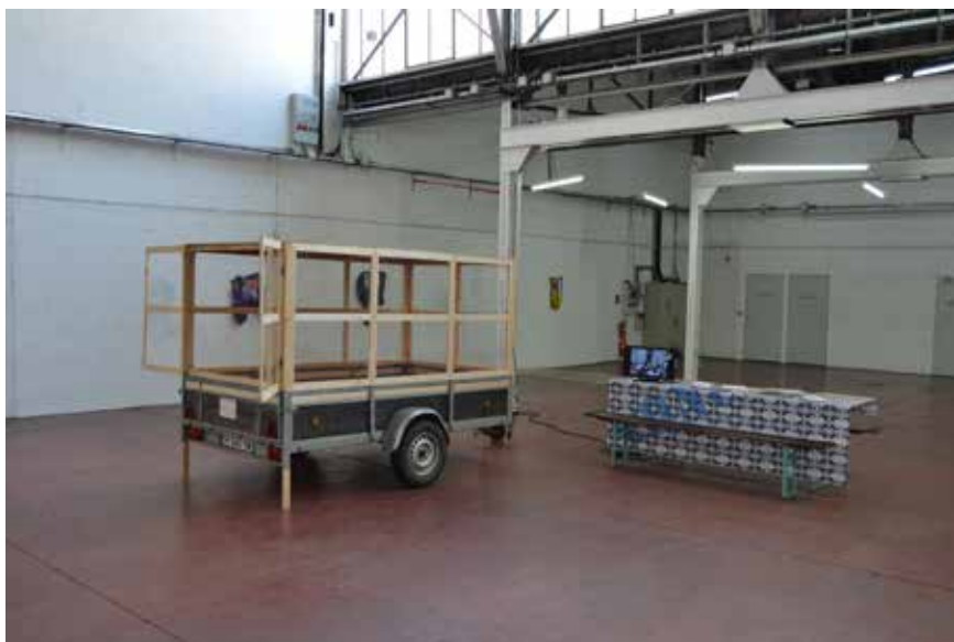
La remorque vitrée de cONcErn présentée à la Tôlerie (Clermont-Ferrand) en juin 2017, pour permettre aux artistes de faire un dépôt d'œuvre via un transport visible.

De même que nous prolongeons la vie d'une œuvre en adaptant sa situation de dépôt à une esthétique nouvelle, nous cherchons des formes de réactivation de l'œuvre au moment de son transport. Ainsi, cONcErn imagine des « convois exceptionnels », des cortèges, des rêveries transitoires et invente des formes de voyage dans lesquelles les œuvres continuent d'exister en rapport avec leur environnement. Par exemple, cONcErn s'intéresse aux moyens de transport qui mettent en avant la visibilité de l'œuvre, la participation du public et qui sont sensibles aux enjeux artistiques.