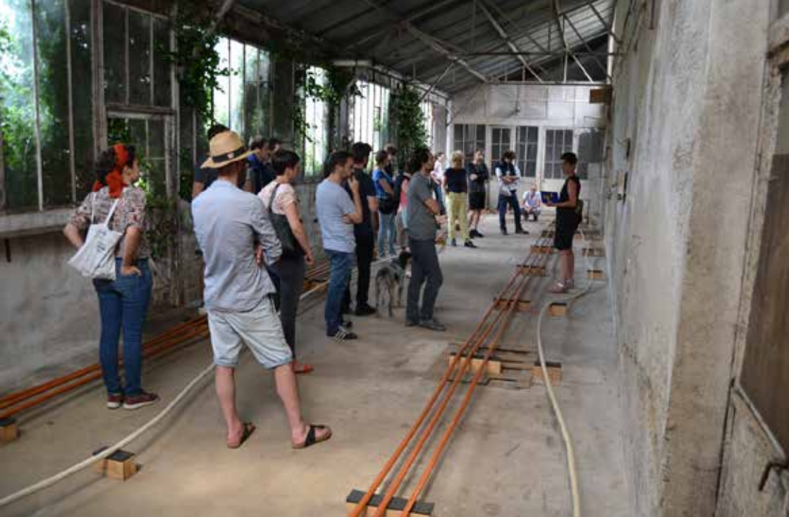
En juillet 2017, une discussion avec le public autour de l'installation Extrusion (2014) de Delphine Reist.