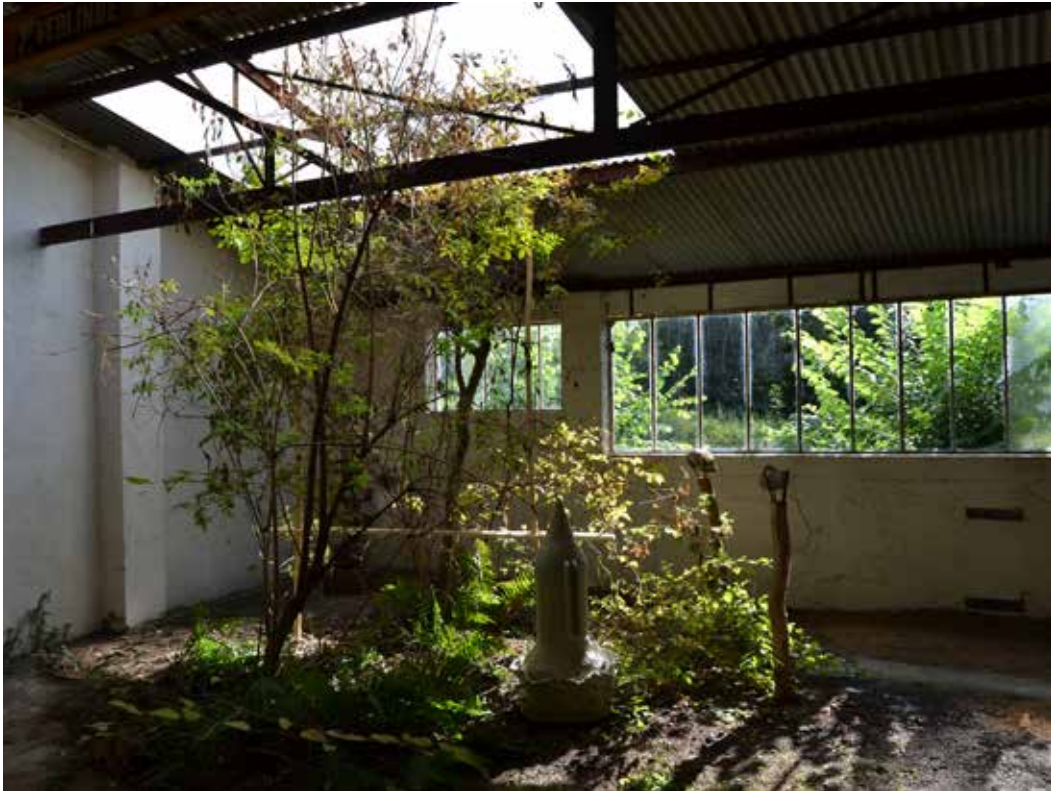
Solibacillus Kalamii (2019) de Ellande Jaureguiberry et Tuteur (2020) de Marine Zonca dans le jardin intérieur de cONcErn.