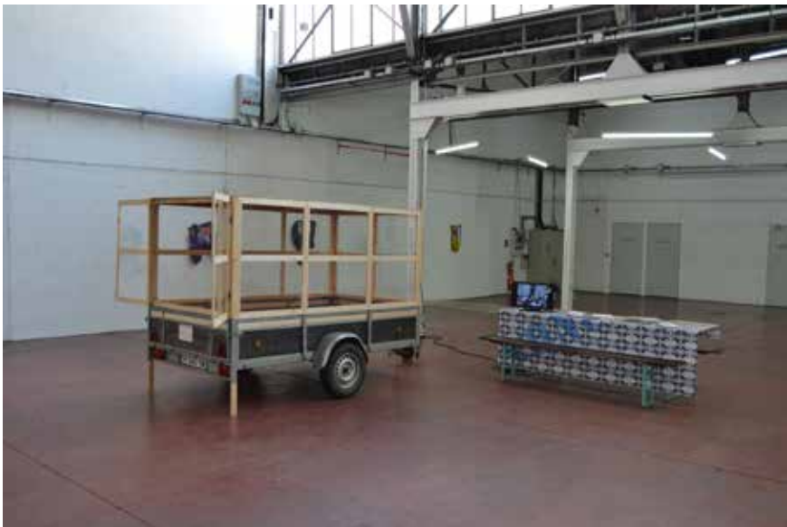
La remorque vitrée de cONcErn présentée à la Tôlerie (Clermont-Ferrand) en juin 2017, pour permettre aux artistes de faire un dépôt d'œuvre via un transport visible.

De même que nous prolongeons la vie d'une œuvre en adaptant sa situation de dépôt à une esthétique nouvelle, nous cherchons des formes de réactivation de l'œuvre au moment de son transport. Ainsi, cONcErn imagine des « convois exceptionnels », des cortèges, des rêveries transitoires et invente des formes de voyage dans lesquelles les œuvres continuent d'exister en rapport avec leur environnement. Par exemple, cONcErn s'intéresse aux moyens de transport qui mettent en avant la visibilité de l'œuvre, la participation du public et qui sont sensibles aux enjeux artistiques.