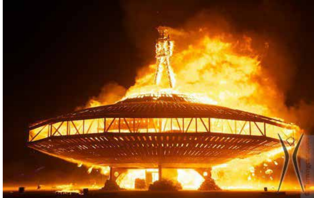
Embrassement de la sculpture The Man au festival Burning Man 2013.

cONcERN voit dans les créations « laissées pour compte » un phénoménal potentiel culturel tant sur le plan pédagogique qu'esthétique. Elles méritent notre attention !